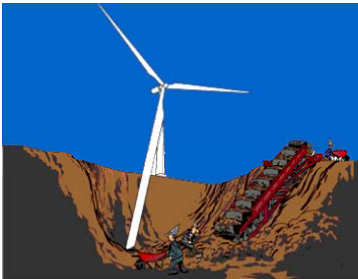
(Tegning af Bryan d'Emil © Vindmølleindustrien 2002)

I beregningerne af vindmøllers produktivitet forudsætter vismændene, at tårnhøjderne i dag stadig er 18 m som i 1980. Da den typiske rotordiameter i dag er 54 m, ville det kræve, at der blev gravet dybe huller i jorden til vindmøllernes vinger.